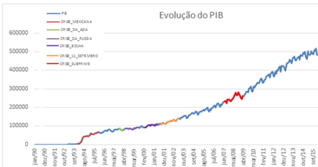
Figura 1 – Evolução do PIB em períodos de crises financeiras mundiais

Com relação ao PIB, o indicador de PIB de uma economia, a Figura 1 apresenta sua evolução no período 1990-2016 e juntamente com a tabela 5 demonstra que o Brasil teve um impacto alto em seu PIB, devido à sua taxa de evolução ter ficado abaixo da média mundial, inclusive de países com economias menos desenvolvidas, como os países da América Latina e Caribe.